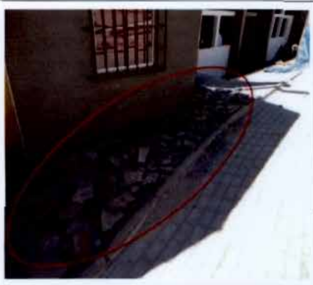
Fotografía N° 14