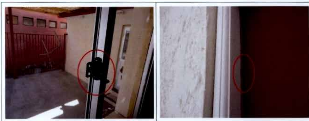
Fotografía N° 01

i. Se comprobó que el seguro de la ventana de la cocina del centro de madres de la localidad de Francia, no funciona correctamente, así también se advirtió que las puertas de dicho centro de madres como el que se encuentra ubicado en Chapiquilita no cuentan con un cierre completo, tal como se observa en las fotografías N os . 01 y 02.