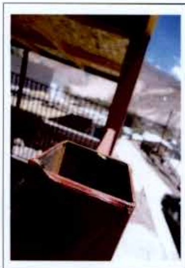
Fotografía N° 11

vii. Se constató que las excavaciones al exterior del inmueble de Alto Camiña destinadas a la instalación de la tubería de la red domiciliaria de agua potable, no cumplían con la profundidad mínima exigida en el artículo 102, inciso "a.a", del D.S. N° 50, de 2002, del Ministerio de Obras Públicas, que aprueba el Reglamento de Instalaciones Domiciliarias de Agua Potable y de Alcantarillado, el cual estipula que las claves de las tuberías de agua potable deben quedar enterradas, como mínimo, a 50 centímetros del nivel superior del terreno, situación que se visualiza en la fotografía N° 12.