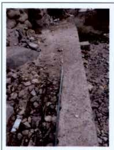
Fotografía N° 12

vii. Se constató que las excavaciones al exterior del inmueble de Alto Camiña destinadas a la instalación de la tubería de la red domiciliaria de agua potable, no cumplían con la profundidad mínima exigida en el artículo 102, inciso "a.a", del D.S. N° 50, de 2002, del Ministerio de Obras Públicas, que aprueba el Reglamento de Instalaciones Domiciliarias de Agua Potable y de Alcantarillado, el cual estipula que las claves de las tuberías de agua potable deben quedar enterradas, como mínimo, a 50 centímetros del nivel superior del terreno, situación que se visualiza en la fotografía N° 12.