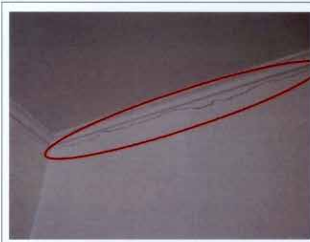
Fotografía N° 09

v. Se evidenció que la parte superior de los muros de los centros de madres de Alto Camiña y Chapiquilta, presentaban fisuras, tal como se aprecia en las fotografías N°s. 09 y 10.