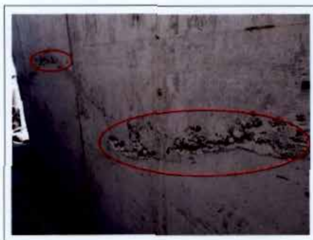
Fotografía N° 15

Se verificó la existencia de nidos de piedras en el muro ubicado en el eje A; ello, producido por la falta de compactación mediante vibrado, lo que implica un incumplimiento a lo especificado en el numeral 11.1 de la norma chilena N° 170 "Hormigón - Requisitos Generales", que indica que "la compactación se debe efectuar con los equipos adecuados y mediante los procedimientos necesarios para que, manteniendo la homogeneidad del hormigón, se pueda rellenar completamente el moldaje sin deformarlo excesivamente y sin producir nidos de piedras.", tal como se muestra en la fotografía N° 15.