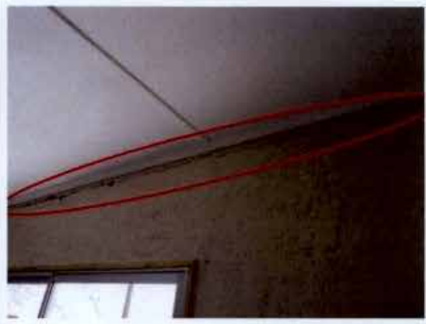
Fotografía N° 10

vi. Se advirtió que los pilares y las barras metálicas del cierre del centro de madres de Chapiquilta, no poseían las respectivas tapas, tal como se muestra en la fotografía N° 11.