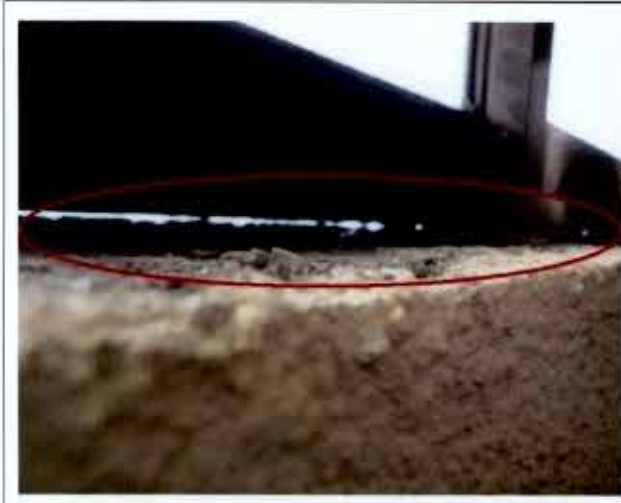
Fotografía N° 07