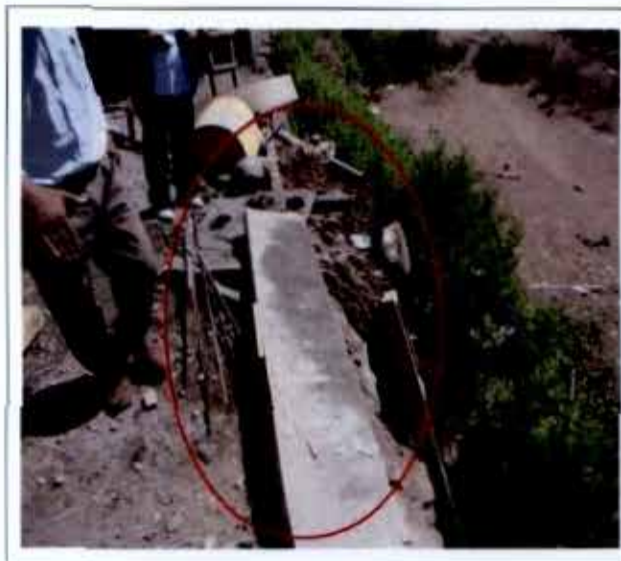
Fotografía N° 13

entrega definitiva de la obra.", hecho que se observa en las fotografías N os . 13 y 14.