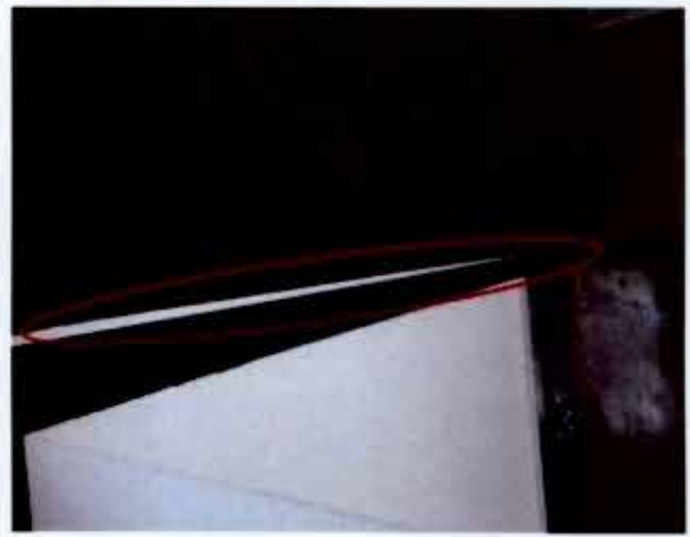
Fotografía N° 08

v. Se evidenció que la parte superior de los muros de los centros de madres de Alto Camiña y Chapiquilta, presentaban fisuras, tal como se aprecia en las fotografías N°s. 09 y 10.