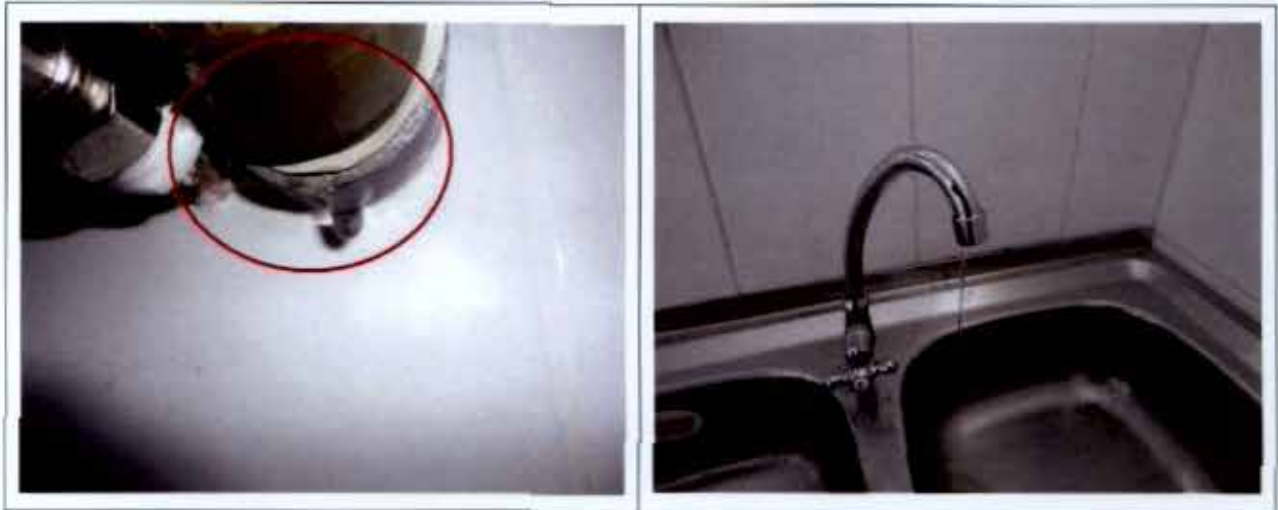
Fotografía N° 03